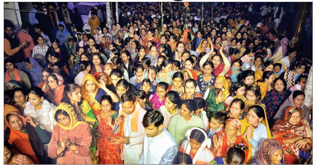
भौरासा में गुंजा तुमरक्षक काहू को डरना